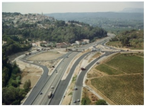
ROUTES , AUTOROUTES